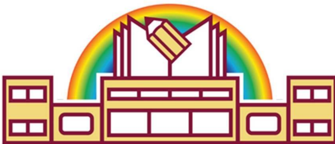
Escola Básica do 1º Ciclo com Pré do Estreito da Calheta

Nº DE CÓDIGO DO ESTABELECIMENTO DE ENSINO: 3101106