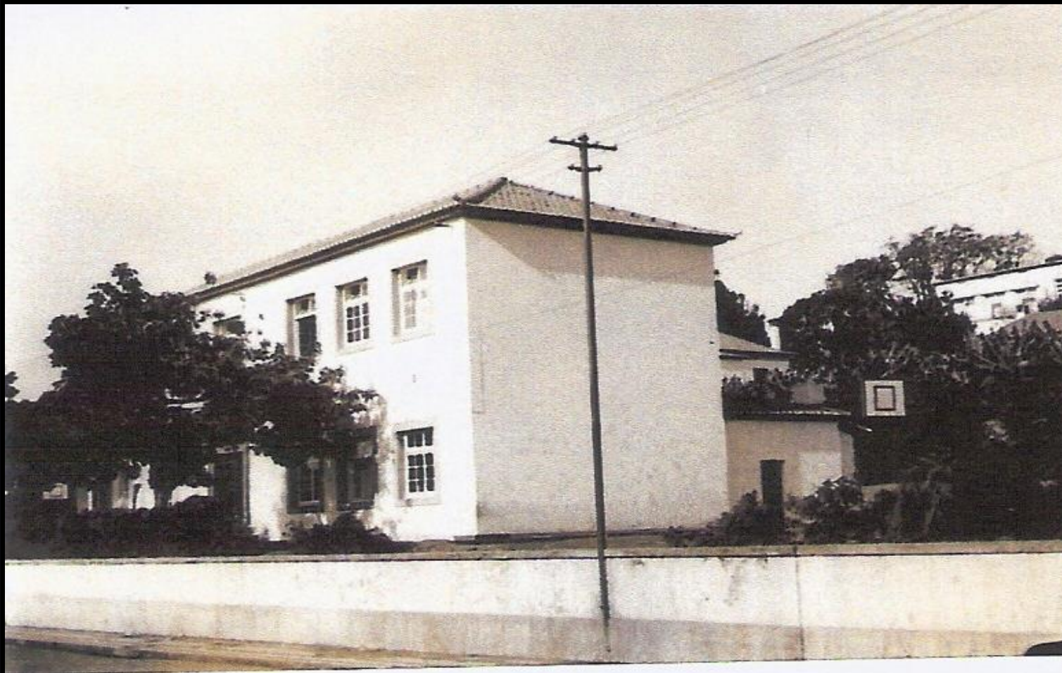
Escola Masculina n.º 5