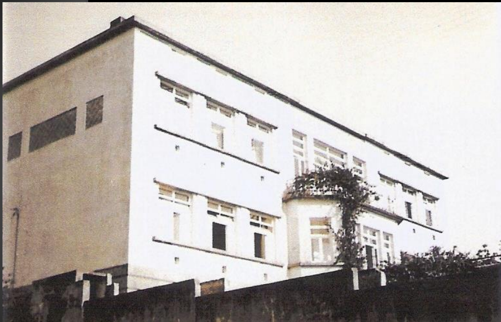
Escola Feminina n.º 4